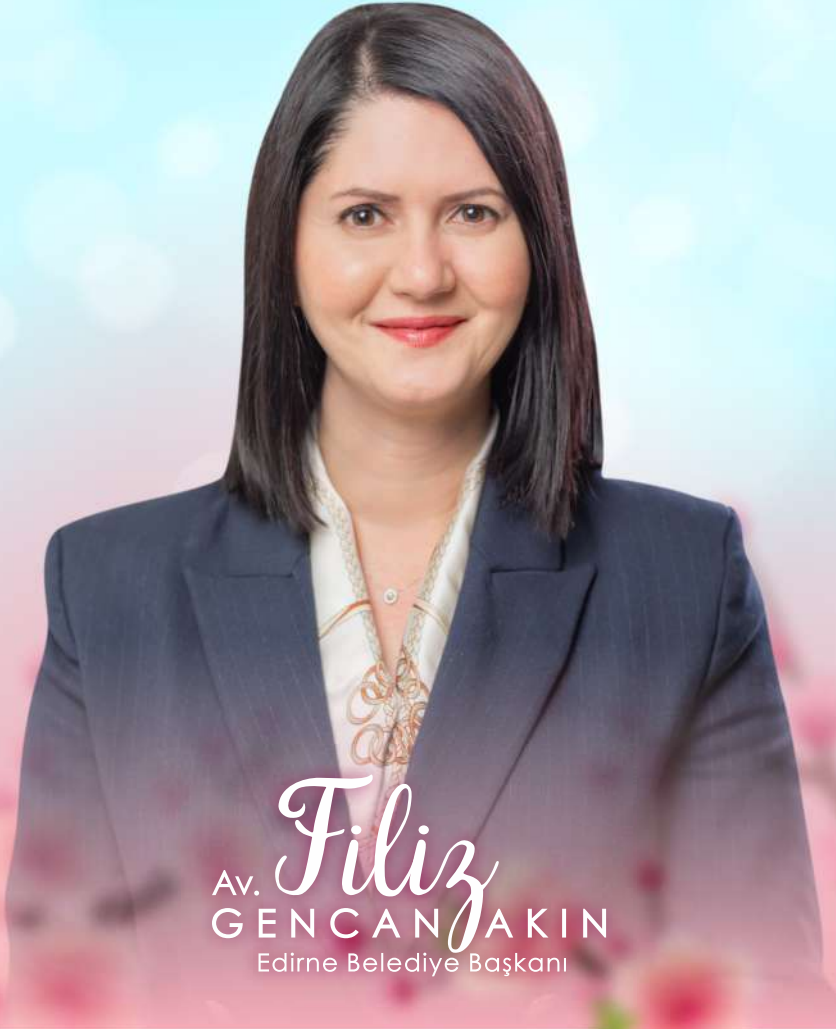
Av. Filiz GENCAN AKIN Edirne Belediye Başkanı