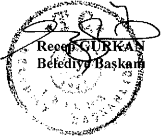
Recep GURKAN Belediye Başkanı

İşaretle yapılan oylama sonucunda; Sezgin TURAN vs.'nin 26.09.2019 tarihli dilekçesi ile Edirne Merkez Yıldırım Hacısarraf Mahallesi Ada:976 Parsel: 55, 56, 57, 58, 59, 60, 61, 62, 63, 64, 65, 66, 67, 68, 69, 70, 71, 72, 73, 74, 75, 76 sayılı taşınmazların imar planında konut alanı iken park alanı yapıldığı, kum ocağına bitişik olan bölgede dolgu işlemlerinin büyük oranda tamamlandığı, taşınmazlar üzerinde ruhsatlı ve yapı kullanması olan yapıların bulunduğu belirtilerek taşınmazların 2005 yılından önceki imar planında olduğu gibi konut alanı olarak imar planı değişikliği yapılması talebi ile ilgili olarak yapılan incelemeler neticesinde; Edirne Merkez Yıldırım Hacısarraf Mahallesi Ada:976 Parsel: 55, 56, 57, 58, 59, 60, 61, 62, 63, 64, 65, 66, 67, 68, 69, 70, 71, 72, 73, 74, 75, 76 sayılı taşınmazların imar planında kısmen park alanında, kısmen yolda ve kısmen de harfiyat yasağı uygulanacak alanda kaldığı tespit edilmiş olup talebin Belediyemiz tarafından jeolojik etüt yaptırıldıktan sonra değerlendirilmesine oybirliği ile karar verilmiştir.