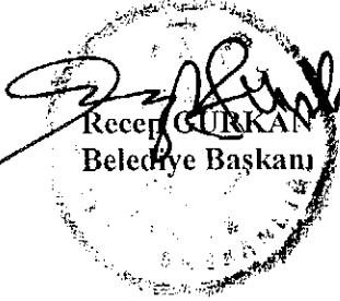
Recep GURKAN Belediye Başkanı

Gündemde görüşülecek başka bir madde olmadığından Belediye Meclisinin 19.04.2021 günü Nisan ayında yapmış olduğu 2021 Yılı dönemine ait I. olağanüstü toplantısına son verilmiştir.