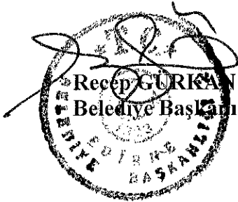
Recep GÜRKAN Belediye Başkanı

İşaretle yapılan oylama sonucunda; İsmail ÖZYÜREK' in 31.08.2018 tarihli dilekçesi ile Tapunun Edirne Merkez Abdurrahman Mahallesi ada:613, parsel:42 sayılı taşınmazlarının imar hattının düzeltilmesi talebi üzerine yapılan inceleme neticesinde; söz konusu Edirne Merkez Abdurrahman Mahallesi ada:613, parsel:42 sayılı taşınmazın mevcut imar planında ayrık nizam 4 katlı konut alanında kaldığı tespit edilmiş olup, talep ile ilgili hazırlanan plan değişikliğinde değişiklikten etkilenen 40 ve 43 sayılı taşınmaz maliklerinin de muvafakatnameleri olduğu yönünde İmar ve Şehircilik Müdürlüğü'nün raporuna istinaden, imar hattının düzeltildiği 1/1000 ölçekli uygulama imar planı değişikliğinin uygun olduğuna oybirliği ile karar verilmiştir.