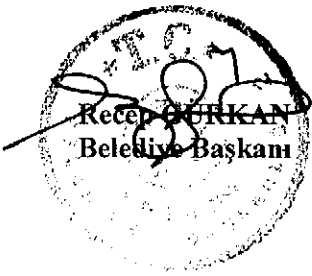
Recep GÜRKAN Belediye Başkanı

İşaretle yapılan oylama sonucunda; Edirne Belediye Başkanlığı ve İstanbul Ticaret Üniversitesi Rektörlüğü (Ulaştırma Sistemleri Uygulama ve Araştırma Merkezi ) ile Edirne Elektronik Denetleme Sistemi kuruluş, işletme, kapanış ve yeniden açılış süreci sonrasında yürütülecek çalışmalara ilişkin bir işbirliğine ihtiyaç bulunmaktadır. İstanbul Ticaret Üniversitesi Rektörlüğü (Ulaştırma Sistemleri Uygulama ve Araştırma Merkezi ) ile ortak işbirliği projesi için protokol imzalanmasına ve bu protokolü imzalamak üzere Edirne Belediye Başkanı Recep GÜRKAN’a yetki verilmesine oybirliği ile karar verilmiştir.