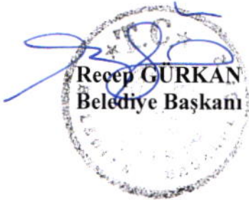
Recep GÜRKAN Belediye Başkanı

Ayşekadın Taksi Durağının araç depolama alanına ilave olarak Yancıkçışahin Mahallesi, Şehit Hasan Danacı sokaktaki yeşil alanın yanında bulunan cepte Ayşekadın Taksi Durağı esnafının kullanacağı 3 (üç) araçlık depolama alanın işaretlenerek belirlenmesine.