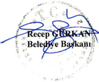
Recep GÜRKAN Belediye Başkanı

Geçici Madde 4' ten sonra gelmek üzere; “Geçici Madde 5: Geçici Madde 4' te belirtilen hükmün 31.12.2022 tarihine kadar uygulanmaması” maddesinin eklenmesine.